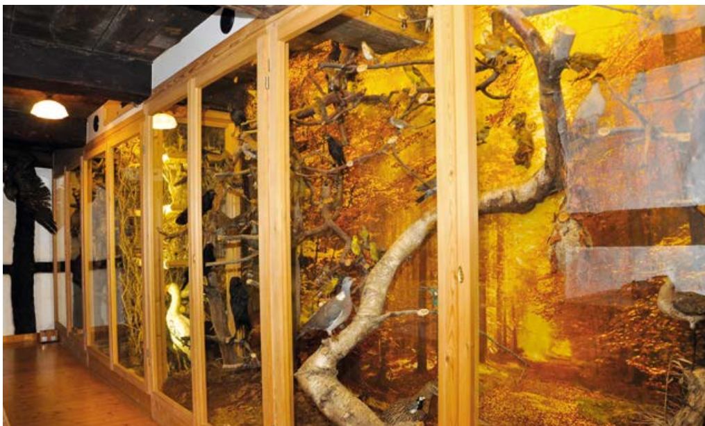
Aktuelle Teilansicht der großen Präsentations-Voliere mit 192 Exponaten im Obergeschoss des Rietberger Heimathauses.

Mit Arnold Edenfeld verliert der Heimatverein und darüber hinaus ganz Rietberg eine hochgeschätzte, lebenswürdige Persönlichkeit, die stets in guter Erinnerung behalten und der ein ehrendes Andenken bewahrt wird.