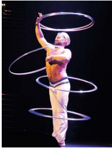
Einen unterhaltsamen Abend erlebten die Zuschauer bei „Best of Varieté“ in der Cultura. Das Spektrum des Bühnenprogramms reichte von Akrobatik bis zur verblüffenden Mentalistin.

Zwischen der mentalen Magie, die die Zuschauer ratlos zurückließ, wurde ein unterhaltsames Potpourri verschiedener Artisten geboten. Tigris präsentierte höchst an-