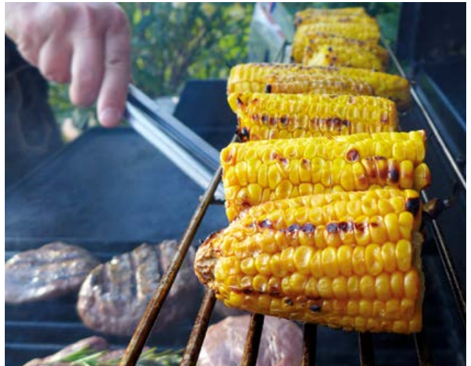
Die Grillsaison ist eröffnet und viele neue Köstlichkeiten werden auf den heimischen Grills zubereitet.

Der Gesetzgeber gibt zum Thema Grillen leider keine klare Antwort: Er sagt, dass ein generelles Grillverbot ge-