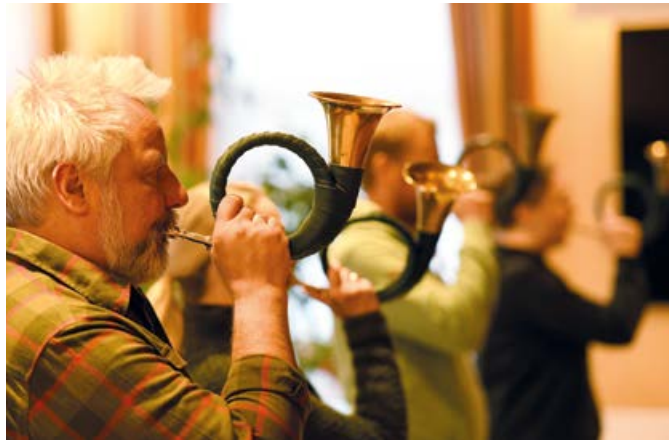
Lippen und Bauchmuskel werden beim Jagdhornblasen ordentlich angestrengt.

in die Technik des Jagdhornblasens reinzukommen. Dazu gehört es dann auch, Zuhause täglich zu üben.“ Denn einfach ist das klassische Jagdhorn – Pless-Horn genannt, das auf der Tonart B basiert, nicht zu spielen. Die fünf Naturtöne können mit veränderter Lippenanspannung erzeugt werden. Dazu ist auch der richtige Druck aus dem Bauch wichtig. „Zwischen der Trompete und dem Jagdhorn gibt es eine Verwandtschaft, doch beim Jagdhorn fehlen die Ventile“, kennt Kammertöns die Schwierigkeiten. Er spielt selbst auch Trompete und zudem noch