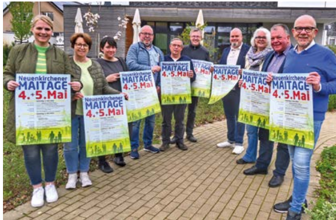
Die Vertreter aus Vereinen, Organisationen und örtlichen Parteien präsentieren die Maitage in Neuenkirchen.

Um 17 Uhr am Samstag und zur gleichen Zeit auch am Sonntag zeigt die Jugendgruppe Hicra im Kolpinghaus den Film „Die mitreißende Geschichte der Gastarbeiter“: Die Geschichte der Gastarbeiter, die Ende der 1960er, Anfang der 1970er Jahre aus der Türkei nach Deutschland ge-