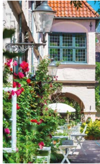
Der Füchtingshof in der Lübecker Altstadt ist dem Mäzen Johann Füchting zu verdanken.