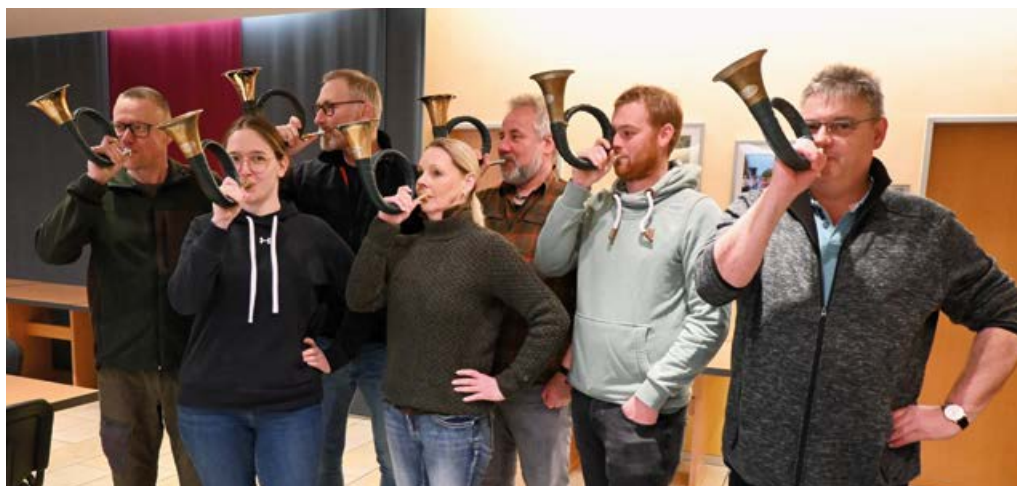
Der aktuelle Anfängerkurs bereitet sich auf die „Jäger-Hut-Abzeichen“-Prüfung vor.

– benötigen. „Man sollte aber mit der Luft haushalten, deshalb ist auch gar nicht nötig, mit zu viel Power und zu laut zu spielen“, hat Kammertöns immer wieder wichtige Tipps. Damit hält er den Kurs bei Laune, die aber als Jägerinnen und Jäger nicht unbedingt motiviert werden müssen. Für sie gehöre das Jagdhorn fest zur Jagd und sei ein Brauchtum, was gepflegt werden müsse. Nicht zuletzt auch zu Ehren des Wildes.