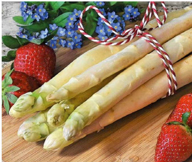
Die Spargelsaison hat begonnen.

Auch das gemeldete warme Wetter für die kommenden Tage ist für den Spargel optimal. Damit die Ernte gut anlaufen kann, wäre nun eine längere Trockenperiode wünschenswert. Den ersten Spargel ernten die Bäuerinnen und Bauern aus Minitunneln. Bei dieser Anbaumethode wird der Spargeldamm mit Hilfe der Sonnenenergie, die von den Minitunneln gut aufgenommen wird, aufgeheizt. Die Erde im Spargeldamm wird dadurch schneller und intensiver erwärmt und lässt den Spargel früher austreiben. Die weitere Entwicklung des Angebots hängt nun vom Wetter ab, denn das Stängengemüse liebt es sonnig und warm.