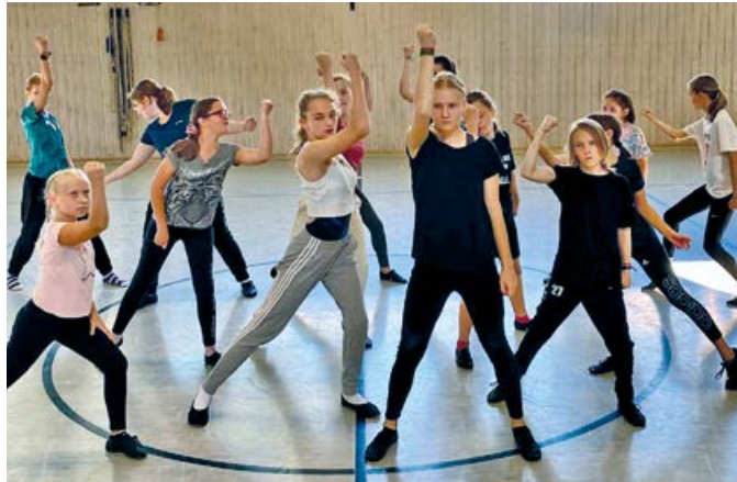
Teilnehmer des Musicals „Bring it on“ bei Übungen zum Hip-hop-Tanz