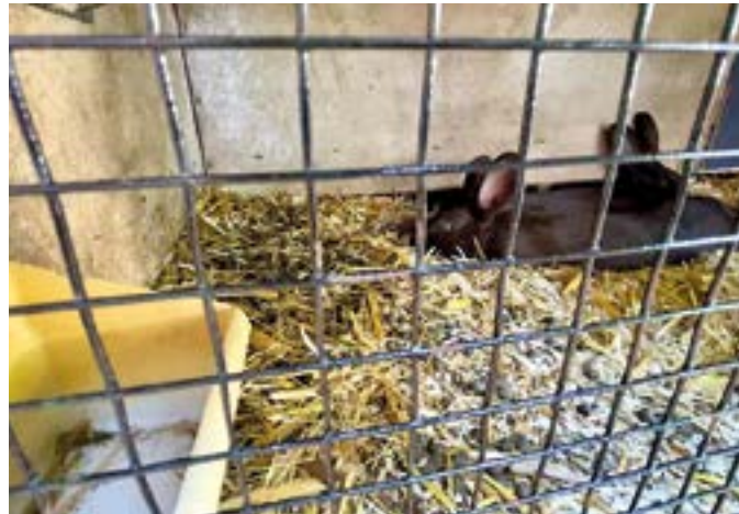
Am 17. Juli entstand dieses Foto. Die Kaninchen hatten kein Futter, kein oder nur verdrecktes Wasser und liegen in schmutzigen kleinen Käfigen. Draußen waren es über 30 Grad.

Auf die Beschwerde sei umgehend reagiert worden, heißt es aus dem Rathaus. Mitarbeiter der Park-GmbH hatten die Vertreter des Rassekaninchenzuchtvereins W376 informiert, die binnen kürzester Zeit vor Ort waren, um für frisches Wasser zu sorgen. Einzelne Tiere wurden zudem aus warmen Käfigen herausgenommen. „Die Park-GmbH weiß die Kaninchen bei den Züchtern in guten Händen“, ist in einer Stellungnahme zu lesen. Park-Chef Johannes Wiethoff, der den Vorfall als Einzelfall wertet, erklärte dazu,