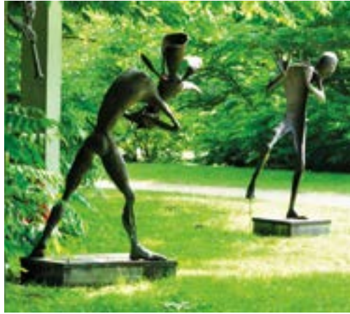
Musiker-Duo im Skulpturenpark Rietberg. Flöten- und Panflötenspieler (l.), Bronze-guss. Neun weitere Werke sind im Park ausgestellt.