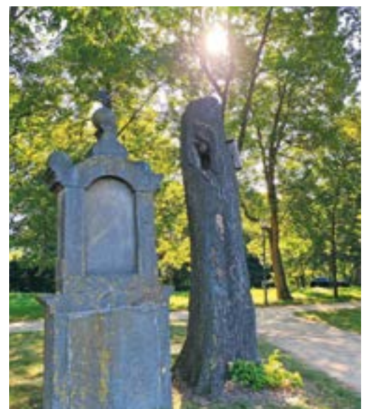
Übrig geblieben ist nur noch der Stamm bis zur Höhe der Bruthöhle und dem Nistkasten.