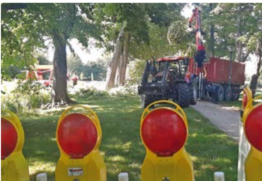
Der Gehweg rund um den Einsatzort wurde für die Dauer der Arbeiten abgesperrt. Am Abend waren alle Spuren beseitigt.

dass sie keine Gefahr mehr für Passanten darstellt. „Wir kappen den Baum aber nicht unterhalb der Bruthöhle“, erklärt Hollenbeck. Die solle nämlich erhalten bleiben. Daneben ist noch ein kleiner Holzkasten befestigt. Das Holz wird übrigens verwertet und nicht einfach nur entsorgt: „Wir transportieren alles zum Bauhof. Dann wird alles gehäckselt und zur Heizkraftanlage der Stadt Rietberg gebracht“, so Hollenbeck.