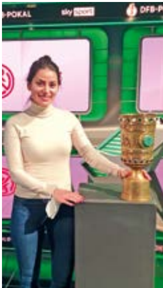
Nicht nur nah an den aktuellen Fußballthemen, sondern auch am „Pott“ bei einer Sky-Sendung zum DFB-Pokal.