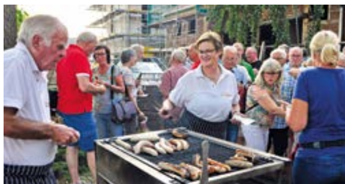
An Duhmes Hof waren die Teilnehmer noch zu appetitlich gerösteten Bratwürstchen und erfrischenden Kaltgetränken eingeladen.