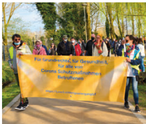
Mit Plakaten zogen die Demonstranten Richtung Innenstadt.