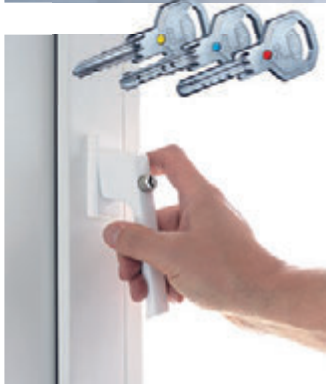
Systeme von GU Automatic sorgen für mehr Sicherheit.

Rietberg. Investitionen in die Sicherheit an Türen und Fenstern lohnen sich. Denn: Gelegenheit macht Diebe. Je umständlicher es einem Einbrecher also gemacht wird einzubrechen, desto wahrscheinlicher ist es, dass er sein Vorhaben aufgibt. Die richtige Sicherheitstechnik an Türen und Fenstern können also Einbrüche vereiteln.