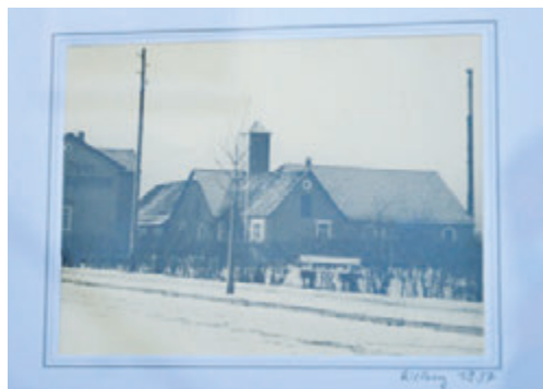
Die Anfänge Paehlers in Rietberg an der Mastholter Straße. Das Areal war als „Grüner Hof“ bekannt.