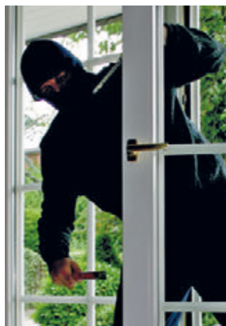
Schnell sind normale Fenster aufgehebelt.

maßnahmen sind. Bei über der Hälfte aller Einbrüche werden Türen und Fenster innerhalb weniger Sekunden aufgehebelt. An diesen Stellen kann ein mechanischer Einbruchschutz helfen. So können Fenster beispielsweise durch Fensterbeschläge oder Rolläden gesichert werden, Türen durch verstärkte Schlösser und Beschläge. Achtung: Kellerfenster und -türen nicht vergessen. Die Bundesregierung fördert über die KfW-Bank direkt den Einbau kriminalpräventiver Maßnahmen. Eigentümer und Mieter können so je nach Höhe der Investitionskosten Zuschüsse von 100 bis 1.600 Euro erhalten. Hierbei werden