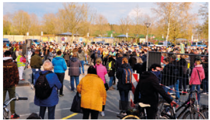
Mehr als 300 Leute versammelten sich am ZOB, um an dem Lichterzug teilzunehmen.