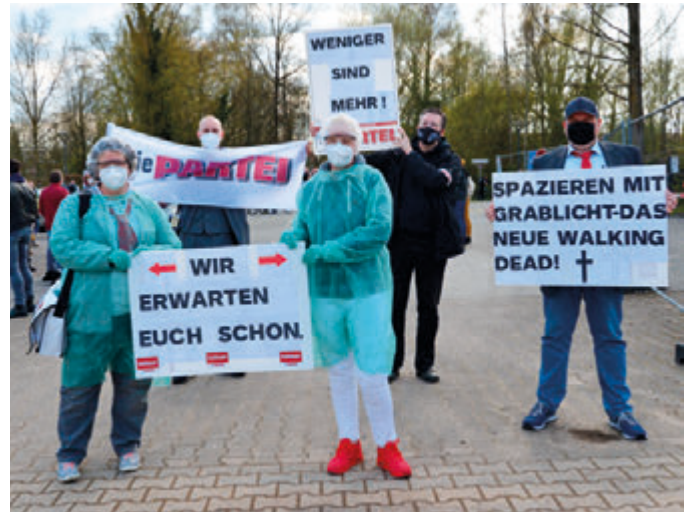
„Die Partei“ hatte sich als Gegendemo angemeldet und setzten ein ruhiges Zeichen gegen den Lichterzug.

Dann setzte sich der Lichterzug unter dem Motto „Gemeinsam – mutig – stark“ in Bewegung und zog mit musikalischer Untermalung und begleitet Richtung Innenstadt. Dort einmal falsch abgebogen marschierten die Demonstranten die Rathausstraße entlang und anschließend zurück zum ZOB, wo Teilnehmer des Protestzuges die Gelegenheit bekamen, ihre Meinung kund zu tun. Der einhellige Tenor war, dass es endlich klare Regeln geben müsse und es kein „weiter so“ geben dürfe. Insbesondere nicht für diejenigen, deren Existenzen bedroht sind. Die Polizei lobte ausdrücklich, dass sich alle Teilnehmer friedlich verhalten hatten.