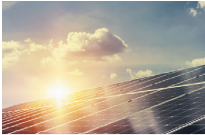
Die Energie vom Dach nutzbar machen.

Für die Installation von Photovoltaikanlagen (PV) gibt es bei Bund und Ländern verschiedene Förderungen. Diese reichen von der Einspeisevergütung oder zinsgünstigen Krediten bis hin zu Zuschüssen für die Energieversorgung. Dabei kommt es darauf an, ob es sich um eine neue PV-Anlage handelt, oder ob eine bestehende erweitert werden soll. Bei der Einspeisevergütung wird dann eine Erweiterung wie eine neue PV-Anlage gewertet und die Förderung erfolgt dann nach aktuellem Tarif, nicht nach dem alten zum Zeitpunkt der Erstinstallation. Dann ist interessant, ob die PV-Anlage auf einem Firmengebäude oder einem Privathaus