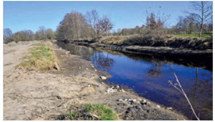
Entlang des Ufers vor Antfängers Mühle müssen die Dämme dringend erneuert werden.