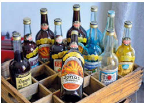
Nicht mehr im Sortiment: Früher stand der Magenbitter „Jonas-Tropfen“ hoch im Kurs.