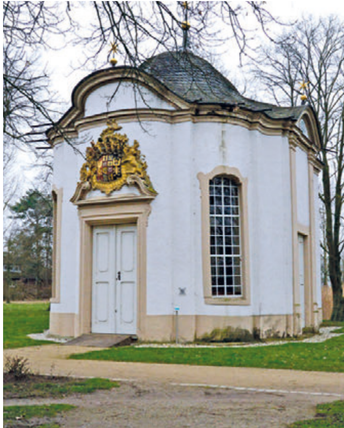
Die Johanneskapelle muss dringend saniert werden. Fördergelder wurden für dieses Jahr jedoch abgelehnt.