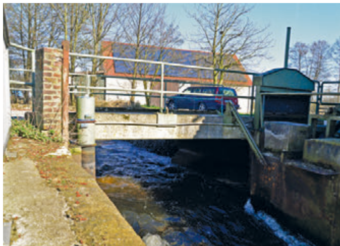
Die Stauanlage an Antfängers Mühle dient nicht nur dem Hochwasserschutz, sondern auch der Stromgewinnung.