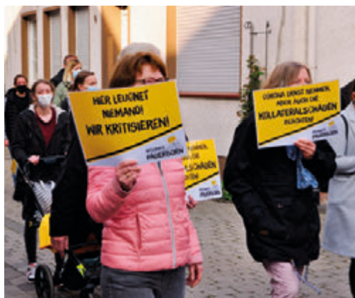
Nicht nur Menschen aus Rietberg liefen mit. Viele Demo-Teilnehmer kamen von außerhalb.