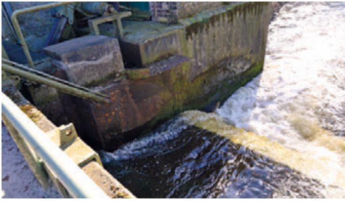
Ungehindert fließt das Wasser der Ems durch die Stauanlage. Die Stauklappe ist komplett heruntergestürzt.