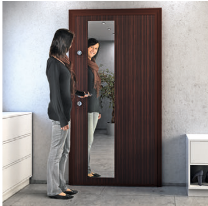
Die HOMetherm® Wohnungseingangstüren-Kollektion bietet für verschiedene Einrichtungsgeschmäcker das Richtige.

Auch vor Lärm aus dem Treppenhaus schützen die Türen. Auch in Sachen Design haben Eigentümer, Bauherren und Architekten eine große Auswahl: Die HOMetherm® Türen greifen den Stil des Hau-